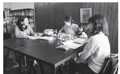
22 いろんな印象の私になろう