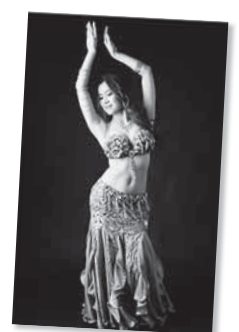
D4 ベリーダンスダイエット