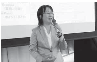
19 さわやかな自己表現 ~アサーション~