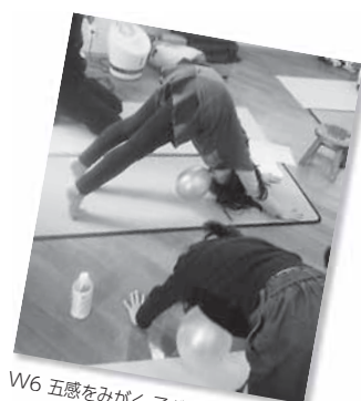
W6 五感をみがく 子どものためのヨガ