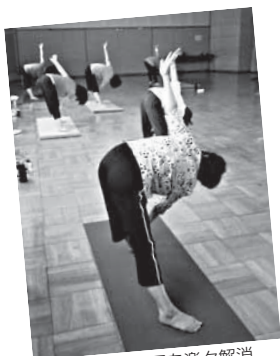
R6 運動不足を楽々解消 50代からの簡単ヨガ体操