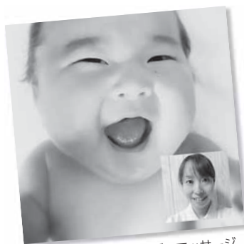
W3 親子でニコニコ ベビーマッサージ