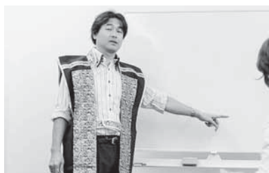
20 歴史×コミュニケーション「レキコミ」