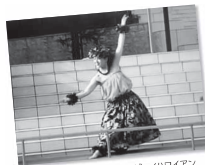
D1 気軽にフラガール エンジョイハワイアン