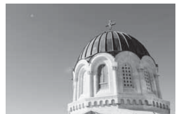
図 海外個人旅行の不安・疑問を解消しよう