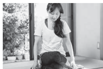
図 陰ヨガ ~春はのびのびとリラククス♪~