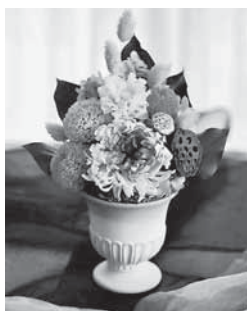
A1 プリザーブドフラワーで作る仏花

小学生向けのプログラミングの基礎(プログラミング検定エントリー級程度)を学習する講座です。パソコンなどは不要ですので、どなたでもお気軽にご参加ください。