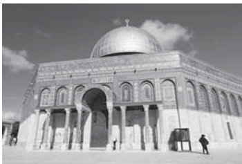
E1 海外ひとり旅の仕立て方

学生以来絵を描いていない、でも「やってみよう」と踏み出して参加された方が、今では仲間と交流し絵を楽しんで描かれています。ぜひ気軽に体験してみてください。