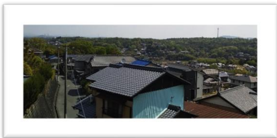
ここから日の出がみえるんですよと説明して下さる大針第二町内会の会長夫妻

*「私は、恵那出身ですので、恵那山の見えるこの場所が大好きです……ベンチを新しくしていただけてありがとうございます。」と大針第二町内会、住民の方からお手紙をいただきました。その場所は高台にあり、御嶽山、恵那山などが一望出来る場所！日の出がそれはそれは綺麗に見えるそうです。この高台に南姫中学校から寄贈されたベンチが置いてありました。ご近所の方々の癒しの場になっていたようです。