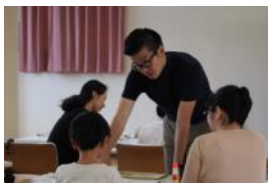
写真3枚程度 ※新聞と一緒に作るので、お好きなテーマや出来事に沿った写真をお持ちください

◆申込み:6月19日(土) 窓口受付 10時～/電話受付 11時～(Tel25-0341)