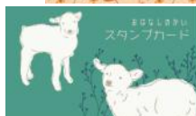
▲ スタンプカードは選べる2デザイン♪

子ども情報センターではおはなしのかいをしてみませんか。随時、募集しております。見学希望などお気軽に職員までお声掛けください。