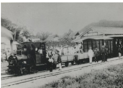
東濃鉄道開業時の試運転列車 御嵩駅