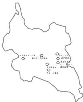
多治見の体育関連施設（昭和中期）