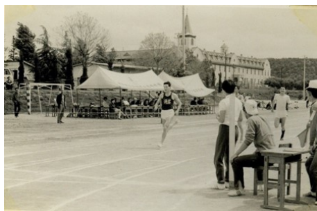
昭和43年（1968）市民総合体育大会 多治見北高グラウンドにて背面に修道院がみえる