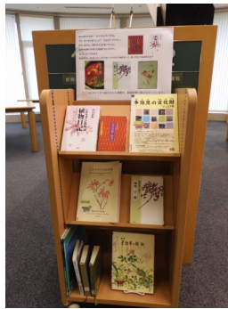
3階ブラウジングコーナーの 関連展示も是非ご覧ください。