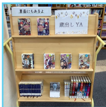
蔵出しYA (ヤングアダルト)