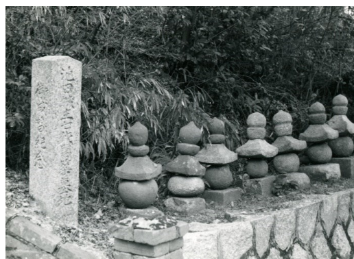
池田真徳稲荷神社境内にある五輪塔 「池田城主七代開築墓地」の石柱は、大正13年に昭和天皇ご成婚を記念し建てられた