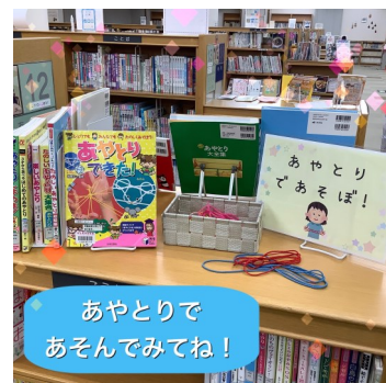
あやとりであそぼ！