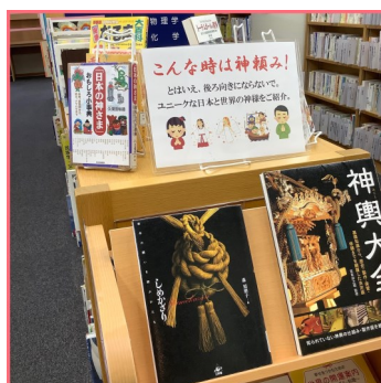
こんな時は神頼み！