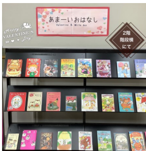
あまーいおはなし (児童文学)