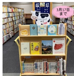
うしといえば酪農