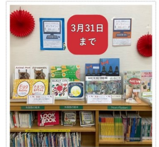
英語でたのしむ 日本&海外の名作絵本

文芸祭作品集 (2階階段横コーナー) 絵付けの技法 銅板転写 (陶磁器資料コーナー) お腹リセット応援レシピ (料理コーナー) 外国文学ベストリーダー100 (外国文学コーナー) and more