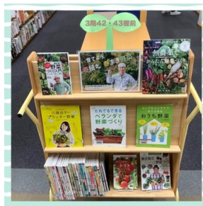
育てよう春植え春まき野菜