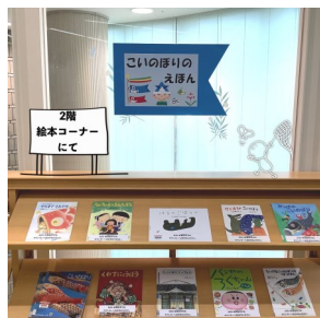
こいのぼりのえほん