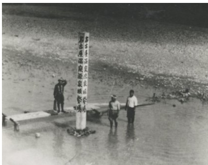
昭和10年 名古屋温泉源泉掘鑿場とある標柱と法被の人、奥は堤防の石垣。

左下の写真は、本町在住の方から寄贈された昭和10年ころの写真です。場所は「現中電前」（昭和40年代）、現在の多治見橋夢広場前の川原で、標柱には「名古屋温泉源泉掘鑿場」とあり、この記事にみられる源泉開鑿のようすと考えられます。右下の写真は新町在住の方に寄贈いただいた写真で「昭和12年3月 多治見橋架替ノ際、橋下ヨリ温泉湧出、其ノ起工式ニ参列記念写ス」というキャプションがあり、温泉開鑿の起工式が厳粛に行われています。さて、その後ですが、資料室に保管されているメモには「挫折する」とあるのみです。