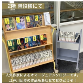
みんなの少年探偵団