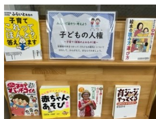
子育て(家族のよみもの篇)