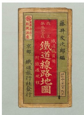
鉄道職員用鐵道線路地圖 (昭和18年)

－ 問い合わせ先：郷土資料室 － ヤマカまなびパーク4階 0572-23-3783 開室日時 火～土曜日 10時～17時 (日・月曜日、祝日は休業)