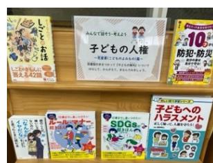
児童書(こどものよみもの篇)