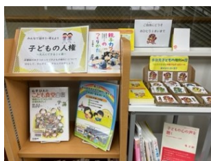
大人にできること篇