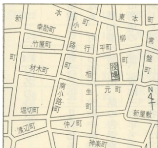
明治末頃の多治見町役場周辺の町

参考文献： 『多治見市史 下』092.15 『多治見町史 巻二』092.15 『多治見町土地宝典』093.34