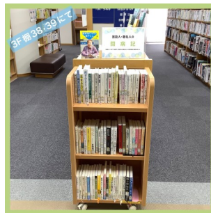
芸能人・著名人の闘病記 (医療健康情報コーナー)