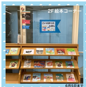
こいのぼりのえほん (2階絵本コーナー)