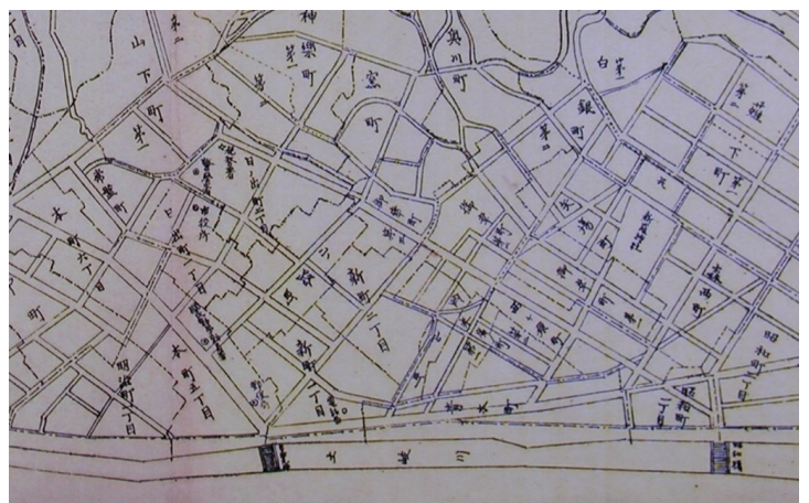
多治見市新町名新町内案内図川南（部分）昭和20年