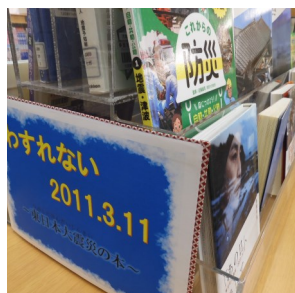
わすれない 2011.3.11 ～東日本大震災の本～