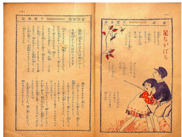
『小学四年生』1929年(昭和4年)5月号より