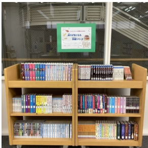
GWの読書におすすめ！続きが 気になる長編シリーズ