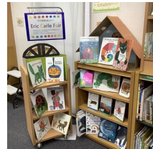
Eric Carle Fair