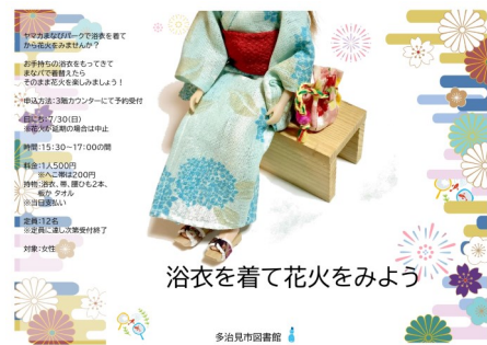
浴衣を着て花火をみよう