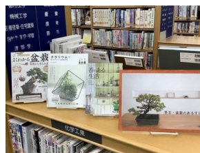
盆栽・苔玉のある生活。 (3階一般書コーナー)