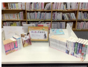
妖と恋の平安時代 (YAコーナー)